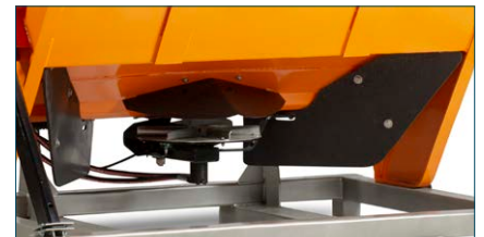
Streuteller mit Schutzgummi