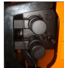
Hydraulikblock für manuelle Steuerung