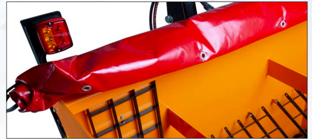
Beleuchtung & Abdeckplane