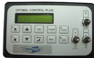
Control-Plus Bedienpult wegeabhängig